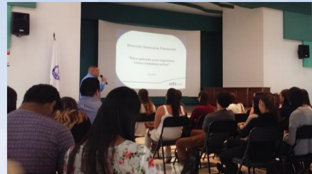
Colegio de Farmacéuticos de Costa Rica