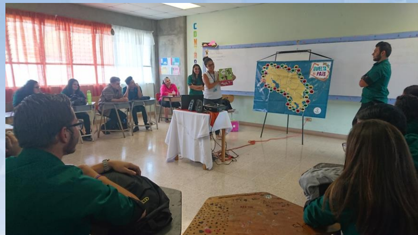
Taller CTP Dulce Nombre de Cartago

Mediante el juego educativo “Vuelta al país” aprenden sobre oficios, profesiones y lugares públicos; que se mantiene con el dinero de los impuestos y sobre aquellos artículos que cuando los compramos debemos pagar el impuesto de ventas.