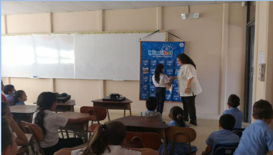
Taller Educación El Cruce de Cirri, Naranjo

135 estudiantes de primaria recibieron el taller de educación y cultura fiscal, durante el mes de marzo.